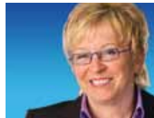
Rita Forst Engineering Entwicklung