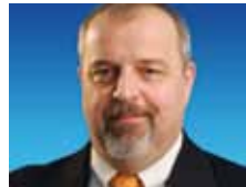
Johan Willems Communications Kommunikation