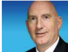
Peter Thom Manufacturing Fertigung